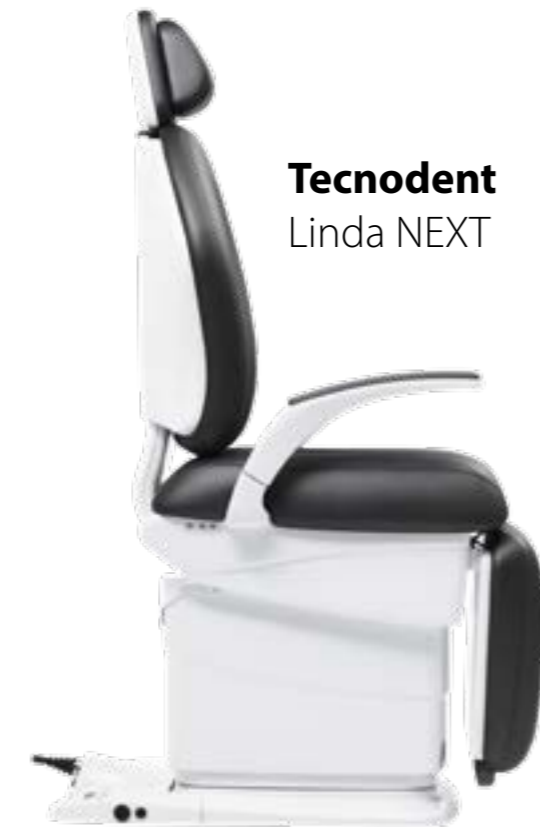
Tecnodent Linda NEXT