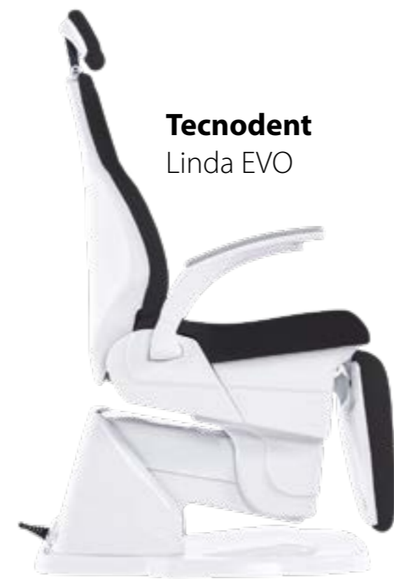
Tecnodent Linda EVO