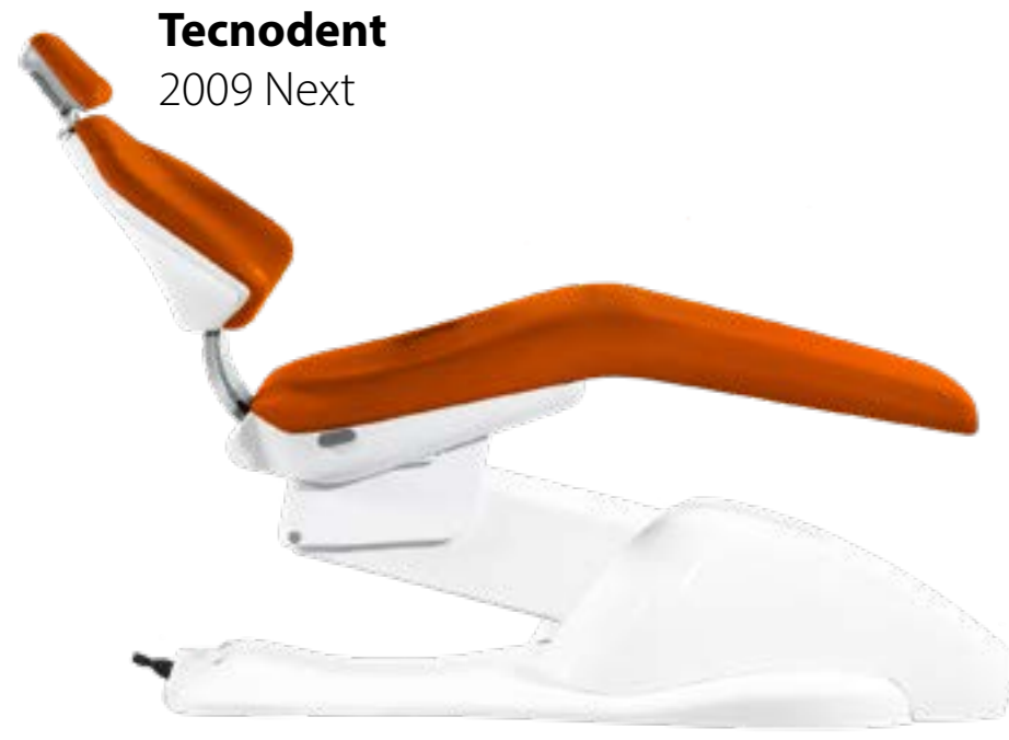
Tecnodent 2009 Next