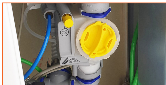
De locatie van het filter verschilt per model